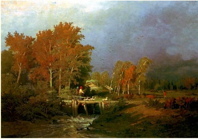
Л. Афремов "Осень"