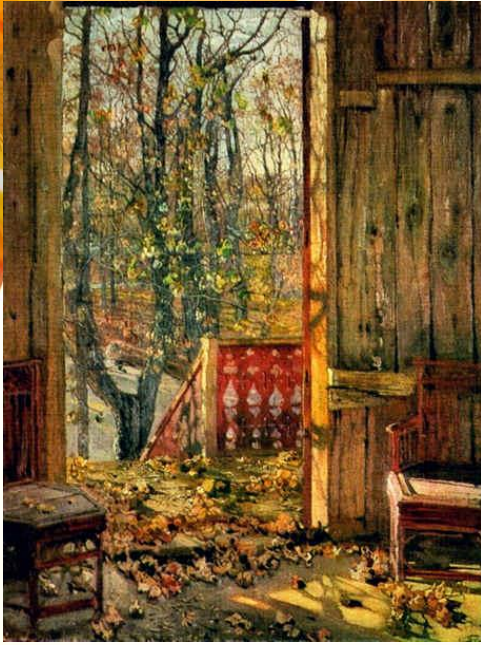
Ф. Васильев «Перед дождем»